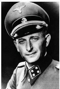
Adolf Eichmann skutečný a filmový.