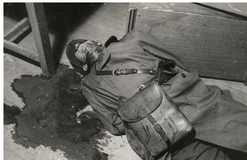
Svědění „hrdinů“ (2008, r. Miroslav Kačor)

Vyprávění o bratřích Mašinech a jejich útěku do Západního Berlína se neslo v duchu jejich heroizace a ztotožnění s jejich verzí příběhu. V době vzniku šlo spíše o ojedinělý počin, který měl za cíl prosadit do širšího povědomí laické veřejnosti příběh třetího odboje.