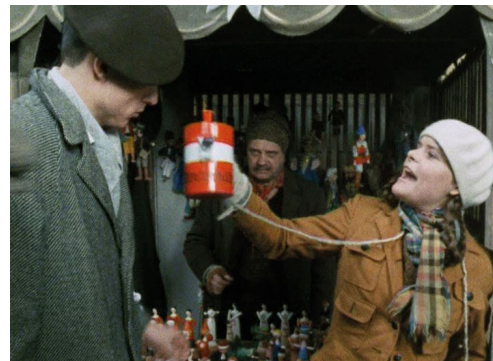
Vlak dětství a naděje – 4. díl – Válka si nevybírá (1985, r. Karel Kachyňa) Děvče ze Svazu německých dívek se snaží od lidí na nádraží získat příspěvek pro Zimní pomoc. Obraz je historicky nepřesný, neboť brněnská Němka s ohledem na televizní publikum hovoří česky. Pro využití ve výuce je podstatnější, že scéna zachycuje sociální vztahy mezi různými obyvateli města. Ukázka nepopisuje minulost jen skrze vnější atributy (kostýmy, rozmístění objektů, vnější popis), ale spíše prostřednictvím mezilidských vztahů, jak na úrovni osobní (německá dívka a stánek Staněk), tak obecné (Němci a Češi).

Didaktickou hodnotu hraných filmů zvyšuje povědomí o jejich konstruovanosti. Diváci se na minulost dívají prostřednictvím herců a posuzují jejich výkony. Do konkrétních filmových postav se prostřednictvím hereckých tváří promítají starší role, které často ovlivňují charakter dramatické figury. V českém prostředí se takto zajímavě vrství historické role třeba v případě populárního Karla Rodena, který krátce po sobě hrál klíčové role v Habermannově mlýně (2010, r. Juraj Herz) a Lidicích (2011, r. Petr Nikolaev). Divácké komentáře na Česko-Slovenské filmové databázi, které generálně souzní s dnešní školní mládeží, naznačují, že diváci tuto zprostředkovanost výrazně reflektují. Hraný film tak je v běžné divácké praxi spojen s povědomím o zprostředkování. Ptáme se, kdo to natočil a proč. Srovnáváme různé filmové verze minulosti, sledujeme originální prvky a naopak kritizujeme, když tvůrci jen reprodukují staré postupy. Z této perspektivy jsou některé filmové minulosti zcela přirozeně lepší než jiné. Široce rozšířená praxe hodnocení a hlasování na ČSFD tento postoj ilustruje. Pohledem didaktiky dějepisu je obdobný přístup k minulosti produktivní, neboť více souzní s rámcovou představou o historii, kterou sdílí současné sociální a kulturní vědy. Prostřednictvím hraného filmu žáci snáze přijmou roli těch, kdo musí minulost analyzovat a interpretovat.