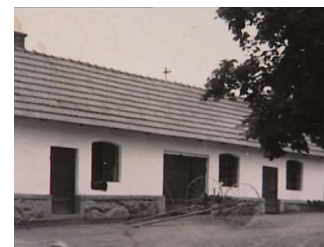
Záběr na fotografii zachycující stav hospodářských stavení Musilova statku na počátku 20. století. Upravenost dvora a výstavnost budovy ilustrují prosperitu selských hospodářů.

Svědectví Raimunda Musila (ale i ostatních pamětníků v dokumentu Ztráta tradice ) aktualizuje mýtus selství tak, jak se utvořil v 19. století. Důraz je položen na dědičnost gruntů a generace selských rodů. Statek je poněkud idealizovaně představen jako soudržná sociální jednotka, ve které vládne patriarchální autorita otce. Zároveň je zdůrazněna modernita selského hospodářství. Vzpomínání pana Musila na selské hospodářství je pozitivní. Statek Musilových měl takovou výměru, že byla práce sezonních dělníků nezbytností, o nich se však v ukázce (a ani nikde jinde v dokumentu) nehovoří. Při analýze sociální situace v polovině 20. století bychom se měli vyvarovat pouhého „obracení znamének“. U nereflektované oslavy selství hrozí návrat k agrární ideologii první poloviny 20. století. Měli bychom si uvědomit, že kritická reflexe sociální situace před nástupem komunismu neznámá automatické přitakání komunistické ideologii. Dokument Olgy Sommerové představuje cennou didaktickou pomůcku – nikoli ovšem jako ilustrace sociální praxe, ale spíše jako pramen, který ukazuje jeden typ vzpomínání na minulost. V duchu multiperspektivity jej lze konfrontovat se svědectvím paní Ježkové (s. 203–204).