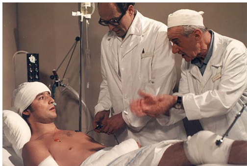
Nemocnice na kraji města (1977, r. Jaroslav Ducek) Jeden z nejoblíbenějších Dietlových seriálů zachycoval osudy personálu jedné okresní nemocnice. Vedle obvyklých seriálových motivů (mezilidské vztahy, prezentace žádoucích modelů chování) probleskují v epizodách dobové způsoby komunikace lékaře s pacienty. V tomto schématu jsou lékaři nezpochybnitelnou autoritou a pacienti v pozici nesvéprávných objektů jejich péče. Při pozorném sledování se nám tak vyjevuje naprosto odlišný ethos lékařské péče.

s ohledem na současného diváka. Může přitom docházet, a většinou také dochází, k určitým posunům zobrazování této praxe, aby byla současnému divákovi srozumitelnější. Tyto ohledy a posuny v dobových filmech odpadají.