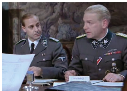
Reinhard Heydrich filmový a skutečný.