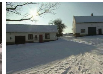
Tentýž pohled, tentokrát již snímáný kamerou, z počátku 21. století. Budovy jsou opět výstavné. Ve filmu se neobjeví fotografie zachycující stopy, které na statku zanechalo socialistické hospodaření. Obraz nás tak orientuje ke kontinuitě mezi minulostí a současností, diskontinuity nejsou zdůrazněny.