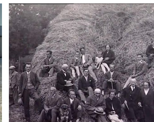
Zaměstnanci statku na fotografii z počátku 20. století. Výjev na fotografii není nijak komentován, hlavním „komentářem“ je hudba evokující melancholické vzpomínání na „belle époque“. Černobílá fotografie zde slouží především jako nástroj „ukotvující“ příběh v minulosti. Forma je zde důležitější než obsah.