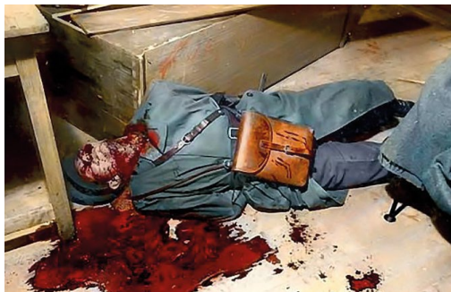
Země bez hrdinů, země bez zločinců (1995, r. Martin Vadas)

Vyprávění o bratřích Mašinech a jejich útěku do Západního Berlína se neslo v duchu jejich heroizace a ztotožnění s jejich verzí příběhu. V době vzniku šlo spíše o ojedinělý počin, který měl za cíl prosadit do širšího povědomí laické veřejnosti příběh třetího odboje.