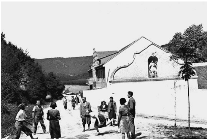
Turisté v okolí hotelu Gruber, 30. léta 20. století.