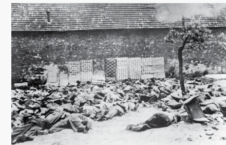
Poprava lidických mužů, Lidice, 10. června 1942.

Tento příklad je vytvořen na základě zkušeností s několika různými sety pramenů, které se osvědčily ve vzdělávání učitelů i v práci se žáky od 2. stupně ZŠ, a to jak v prostředí školy, tak i muzea.