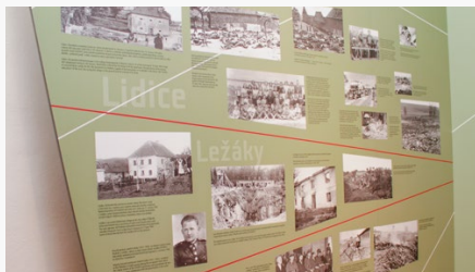
Expozice v Památníku národního útlaku a odboje Panenské Břežany.

Jak se liší vystavování fotografie? Jakou roli hraje v expozicích? Proč je fotografie vystavována?