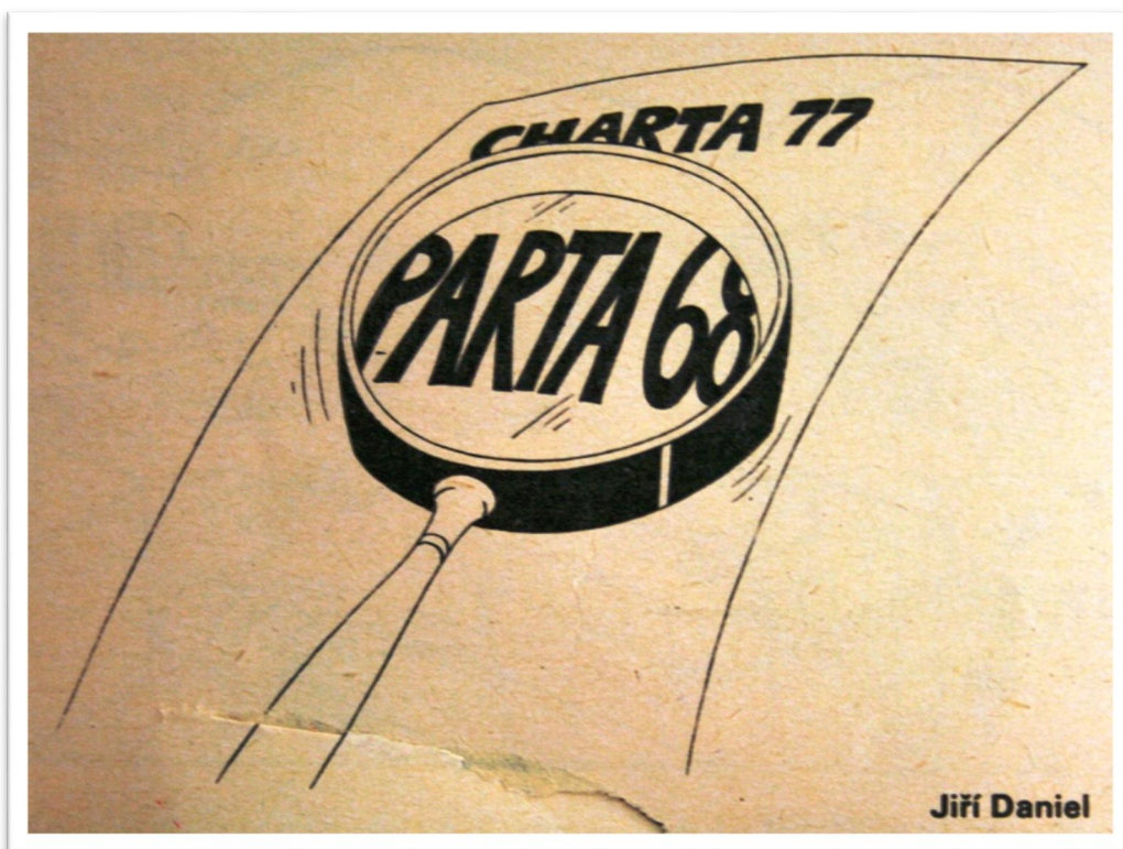
Karikatura 2: Petra 68 (Dikobraz XXXIII, 1977, č. 5, s. 2)