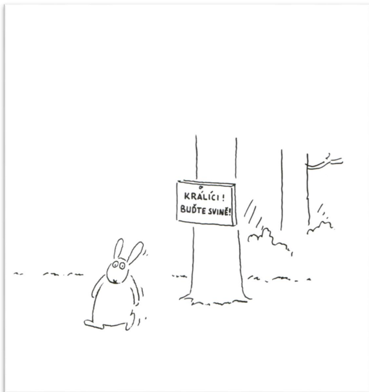
Karikatura 3: Králíci! Buďte svině! (JIRÁNEK, Vladimír: Jak je tomu u lidí. Práce, Praha 1983, nestránkováno )