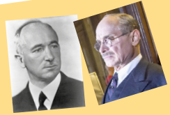
Edvard Beneš (1884-1948)

ČSR přijala pod nátlakem mnichovskou dohodu.