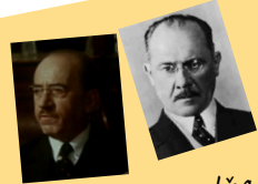
Milan Hodža (1878-1944)

československý prezident v letech 1935-1938 a 1945-1948 a československý prezident v exilu v letech 1940-1945