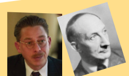
Georges-Étienne Bonnet (1889 - 1973)

britský premiér člen Konzervativní strany zastávce appeasementu